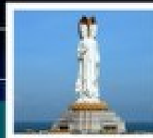
เจ้าแม่กวนอิมทะเล