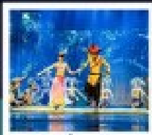
โชว์ซีไห่