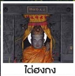
โต๋ฮองกง