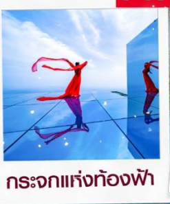
กระจกแห่งท้องฟ้า