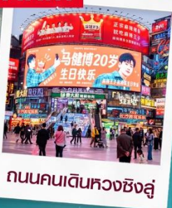
ถนนคนเดินหวงซิงลู่