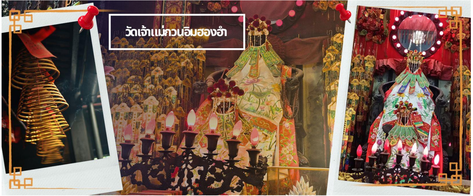
วัดเจ้าแม่วอนอิมของอ้า

จากนั้นนำท่านชม โรงงานจิวเวอรี่ ซึ่งเป็นโรงงานที่มีชื่อเสียงที่สุดของฮ่องกงในเรื่องการออกแบบเครื่องประดับ อาทิเช่น จี้ และแหวนกำหั้น ที่สวยงามโดดเด่นไม่เหมือนใคร ซึ่งถือกำเนิดขึ้นที่นี่และมีชื่อเสียงที่สุดใช้เป็นเครื่องประดับติดตัว และเสริมดวงชะตา สินค้าทุกชิ้นมีเอกสารรับประกันคุณภาพเปลี่ยน ซ่อม ได้ตลอดอายุการใช้งาน หากเกิดการชำรุดจากสินค้าไม่ใช่อุบัติเหตุ