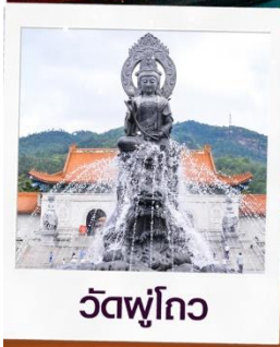
วัดฟูโกว