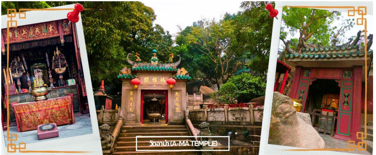
วัดอาม่า (A-MA TEMPLE)

จากนั้นนำท่านสู่ วัดอาม่า (A MA TEMPLE) หนึ่งในวัดสำคัญ ศักดิ์สิทธิ์ และเก่าแก่ที่สุดของมาเก๊า คนไทยคุ้นหูในชื่อ ศาลเจ้าแม่ทับทิม โด่งดังในการขอพรเรื่องหน้าที่การงาน การเงิน และความเป็นสิริมงคลแก่ชีวิต ใครที่ไปกราบไหว้บูชา กลับมาชีวิตในการทำงาน การเงินก็จะดีขึ้น มีเทพศักดิ์สิทธิ์องค์ต่างๆ ซึ่งผสานความเชื่อทางพุทธศาสนา ลัทธิเต๋า คติความเชื่อพื้นบ้าน วัฒนธรรมประเพณี และความศรัทธา โดยตัววัดมีความเก่าแก่อย่างมาก ทำให้มีคุณค่าทางประวัติศาสตร์ จึงทำให้วัดแห่งนี้ กลายเป็นหนึ่งในสถานที่ ที่กำหนดไว้ในศูนย์ประวัติศาสตร์แห่งมาเก๊า แต่เดิมเชื่อกันว่าที่มาของชื่อ มาเก๊า มาจากบริเวณวัดอาม่าแห่งนี้เอง โดยในอดีตจะมีอ่าวที่ชื่อว่า อาม่าก๊อ ก แผลว่า อ่าวของอาม่า จึงเพี้ยนมาเป็นชื่อ มาเก๊า ในปัจจุบันนั่นเอง ต่อมาในปี 2005 วัดอาม่า มาเก๊า ได้รับการขึ้นทะเบียนให้เป็นมรดกโลกโดย UNESCO ซึ่งตัววัดเองมีตำนานเล่าว่า มีเด็กสาวชื่อว่า หลินโม ซึ่งเป็นเด็กที่เฉลียวฉลาด สามารถหยั่งรู้ถึงความเจ็บไข้ได้ป่วยของผู้อื่น อยู่มาวันหนึ่ง หลินโม มีความคิดอยากจะข้ามมายังคาบสมุทรอ่าวเหมิน จึงขอดิดเรือไปกับคนอื่นที่อยากจะข้ามฝั่งด้วยเช่นกัน แต่มีเหตุการณ์ไม่คาดคิด เกิดพายุโหมกระหน่ำ ทำให้เรือหลายลำที่เดินทางไปด้วย กันจมลงสู่ใต้ท้องทะเล ยกเว้นเรือที่มีหลินโม จนทำให้สามารถที่ สามารถเดินทางถึงฝั่งได้โดยสวัสดิภาพ และต่อมาเธอก็ได้มาเสียชีวิตลงบริเวณอ่าว A Ma วิญญาณของเธอก็มักจะ