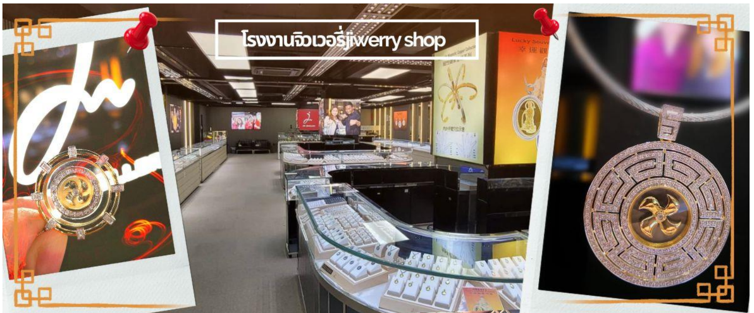
โรงงานจิวเวอรี่jewery shop

จากนั้นนำท่านชม โรงงานจิวเวอรี่ ซึ่งเป็นโรงงานที่มีชื่อเสียงที่สุดของฮ่องกงในเรื่องการออกแบบเครื่องประดับ อาทิเช่น จี้ และแหวนกำหั้น ที่สวยงามโดดเด่นไม่เหมือนใคร ซึ่งถือกำเนิดขึ้นที่นี่และมีชื่อเสียงที่สุดใช้เป็นเครื่องประดับติดตัว และเสริมดวงชะตา สินค้าทุกชิ้นมีเอกสารรับประกันคุณภาพเปลี่ยน ซ่อม ได้ตลอดอายุการใช้งาน หากเกิดการชำรุดจากสินค้าไม่ใช่อุบัติเหตุ