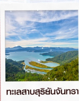
ทะเลสาบสุริยันจันทรา