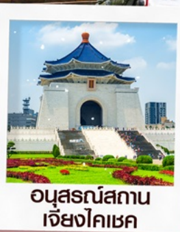
อนุสรณ์สถาน เจียงไคเช็ค