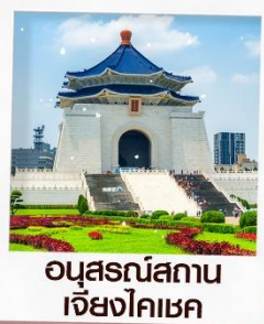
อนุสรณ์สถาน เจียงไคเชก