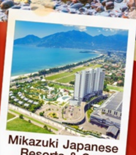
Mikazuki Japanese Resorts & Spa