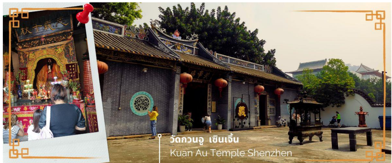
วัดกวนอู เซินเจิ้น Kuan Au Temple Shenzhen

จากนั้นนำท่านเดินทางสู่ วัดกวนอู ไหว้เทพเจ้ากวนอู สัญลักษณ์ของความซื่อสัตย์ ความกตัญญูรู้คุณ ความจงรักภักดี ความกล้าหาญ โชคลาภ และบารมี ท่านเปรียบเสมือนตัวแทนของความเข้มแข็งเด็ดเดี่ยวของอาจไม่ครั้งคร้ามต่อศัตรู ท่านเป็นคนจิตใจมุ่งมั่นคงตั้งขุนเขา มีสติปัญญาเฉลียวฉลาด และไม่เคยประมาทการบูชาขอพรท่านก็หมายถึงขอให้ท่านช่วยอุดช่องว่างไม่ให้เพลิงพล้ำแก่ฝ่ายตรงข้าม และให้เกิดความสมบูรณ์ด้วยคนข้างเคียงที่ซื่อสัตย์ หรือบริวารที่ไว้วางใจได้นั้นเองดังนั้นประชาชนคนจีนจึงนิยมบูชา และกราบไหว้เพื่อความเป็นสิริมงคลต่อตนเอง และครอบครัวในทุกๆ ด้าน