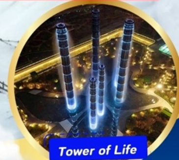
Tower of Life