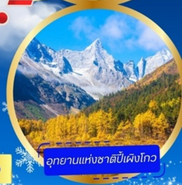
อุทยานแห่งชาติปี้เฟิงโกว