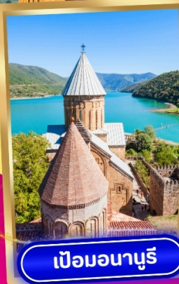
เป็อนนาบูรี