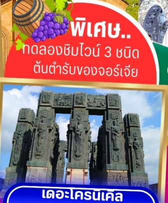
เดอะโครนเคิล ออฟ จอร์เจีย

พิเศษ.. ทดลองชิมไวน์ 3 ชนิด ต้นตำรับของจอร์เจีย