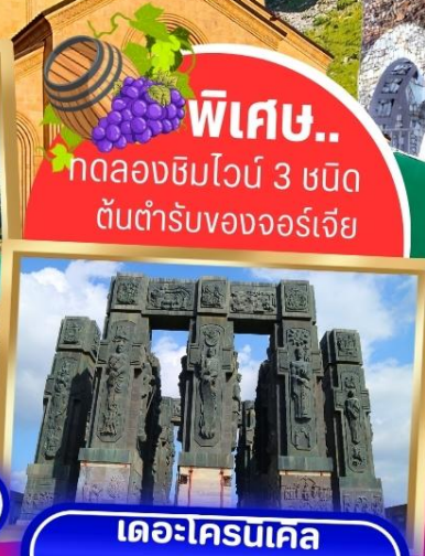
เดอะโครนเคิล ออฟ จอร์เจีย

พิเศษ.. ทดลองชิมไวน์ 3 ชนิด ต้นตำรับของจอร์เจีย