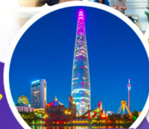
ตึกล็อดเวิลด์

• ช้อปบิง 6 แบนด์ดัง POP Mart / Carlyn / Stand Oil / Emis / Marithe / Mardi