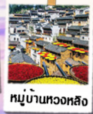
หมู่บ้านทวงหลิง