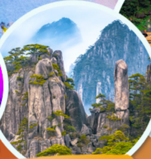
ภูเขาทวงชาน