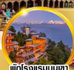
พักโรงแรมบนเขา ชมวิวหิมาลัยสุดฟิน