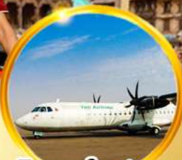
บินภายใน 1 ชม