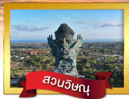
สวนวิษณุ