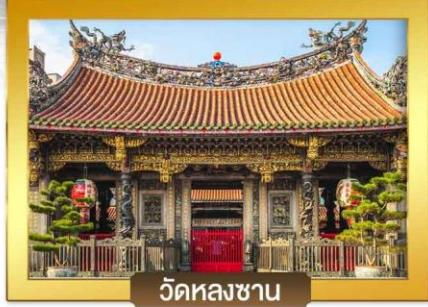
วัดหลงซาน