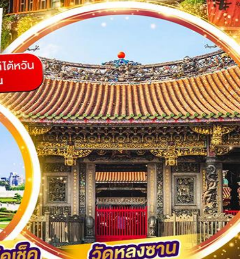
วัดหลงซาบ