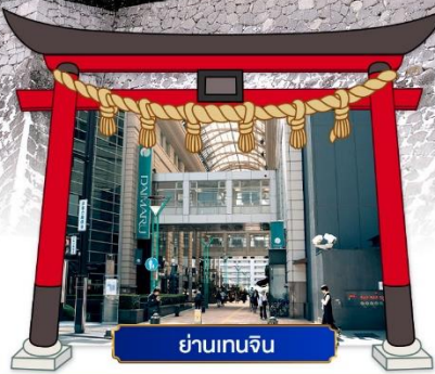
ย่านเท็นจิน