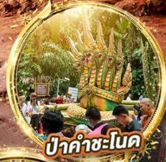
ป่าคำชะโนด