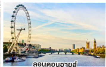
ลอนดอนอายส์