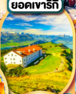
ยอดเขารีกี