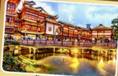
ตลาดร้อยปีเจิ้งหวังเหมียว