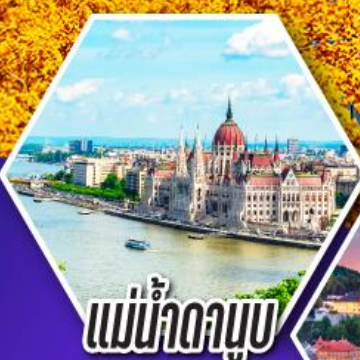
แม่น้ำดานูบ