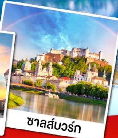
ซาลส์บวร์ก