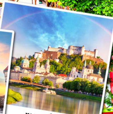
ซาลส์บวร์ก