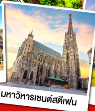
มหาวิหารเซนต์สตีเฟน