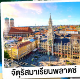
จัตุรัสมาเรียนพลาตซ์