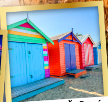
โบรอกเคิล บาร์ตั้ง บ็อกซ์