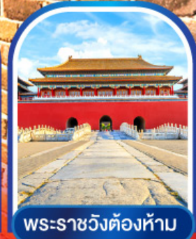
พระราชวังต้องห้าม

15-19, 20-24 ต.ค.67 17,500 03-07, 12-16 พ.ย.67 17,500 18-22, 24-28 พ.ย.67 17,500