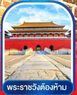
พระราชวังต้องห้าม

15-19, 20-24 ต.ค.67 17,500 03-07, 12-16 พ.ย.67 17,500 18-22, 24-28 พ.ย.67 17,500