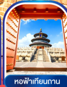
หอฟ้าเทียนถาน