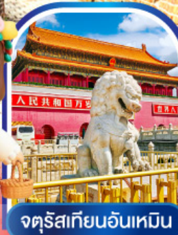
จัตุรัสเทียนอันเหมิน