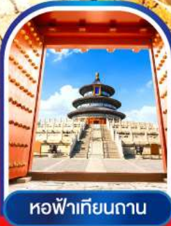
หอฟ้าเทียนถาน