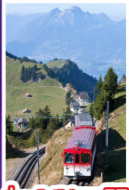
นั่งรถไฟใต้เขาเรริก