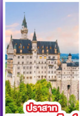
ปราสาท นอยชวานสไตน์