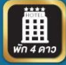
ที่พัก 4 ดาว