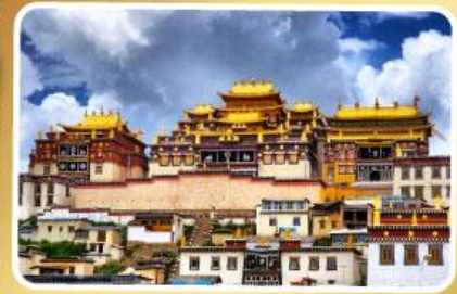
วัดลามะซงจ้านหลิง