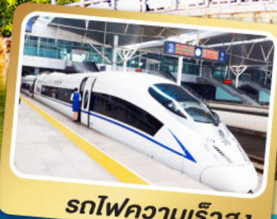
รถไฟความเร็วสูง