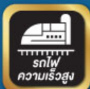
รถไฟ ความเร็วสูง