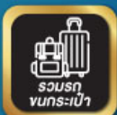
รวมรถ ขนกระเป๋า