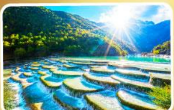
หุบเขาพระจันทร์สีน้ำเงิน