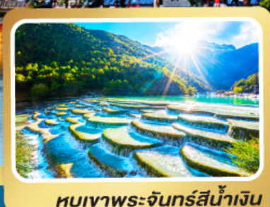
หุบเขาพระจันทร์สีน้ำเงิน