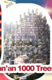
Tian'an 1000 Trees