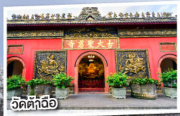
วัดต้าถื่อ