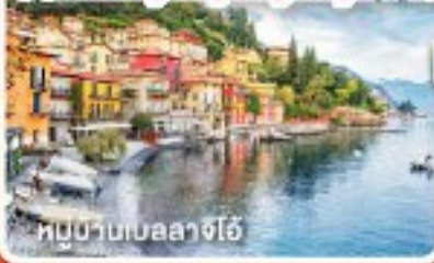
หมู่บ้านเบลลาจีโอ