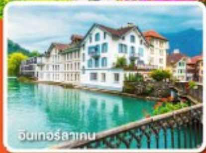
อิมเพอริลาเกน