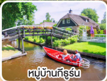
หมู่บ้านกังหัน