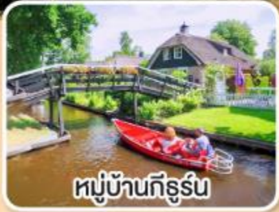
หมู่บ้านกิธูร์น