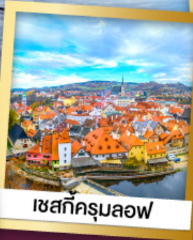
เชสกีครุมลอฟ