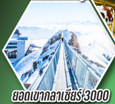
ยอดเขากลาเซียร์ 3000