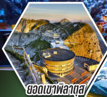
ยอดเขาพิลาตุส