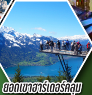
ยอดเขาฮาร์เดอร์คูลม

พักเมืองเซอร์แมท เมืองตากอากาศระดับโลก ที่มีฉากหลังเป็นยอดเขามัตเตอร์ฮอร์น ราคาเริ่มต้น