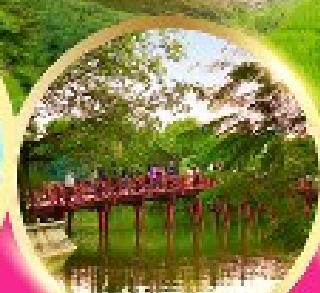
ทะเลสาบคินคาน