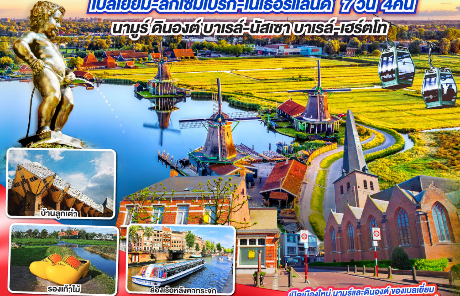
บ้านลูกเต่า

นามูร์-ดินองต์-บารส์-นัสซา-บารส์-เฮร์ตโท