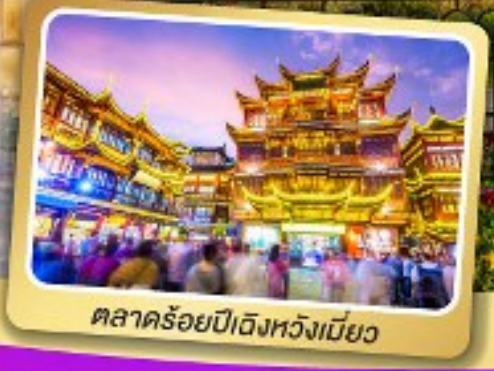
ตลาดร้อยปีดิ้งหวงเหมียว