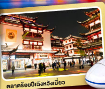
ตลาดร้อยปีเจียงหนิงเมี่ยว