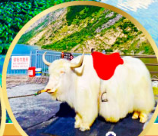
ทะเลสาปเต๋ยซี