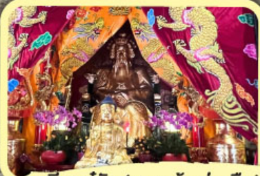
• เอียงบูซิว (ศาลเจ้าพ่อเสือ)