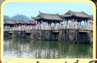
• สะพานโบราณกว่างจี