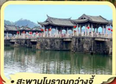
• สะพานโบราณกว้างจี้