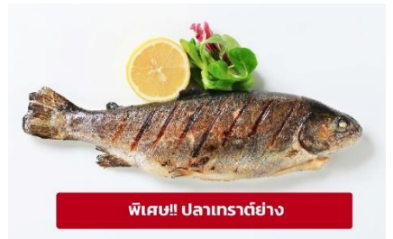
พิเศษ!! ปลาเทราต์ย่าง

เย็น ๑๑ รับประทานอาหารเย็น (มื้อที่4) ที่พัก : Holiday Inn Munich – South หรือโรงแรมระดับใกล้เคียงกัน (ชื่อโรงแรมที่ท่านพัก ทางบริษัทจะทำการแจ้งพร้อมใบนัดหมาย 5-7 วัน ก่อนวันเดินทาง)