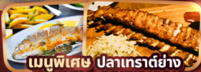
เมนูพิเศษ ปลาเทราต์ย่าง Ribs Of Vienna (1 rack 500g)