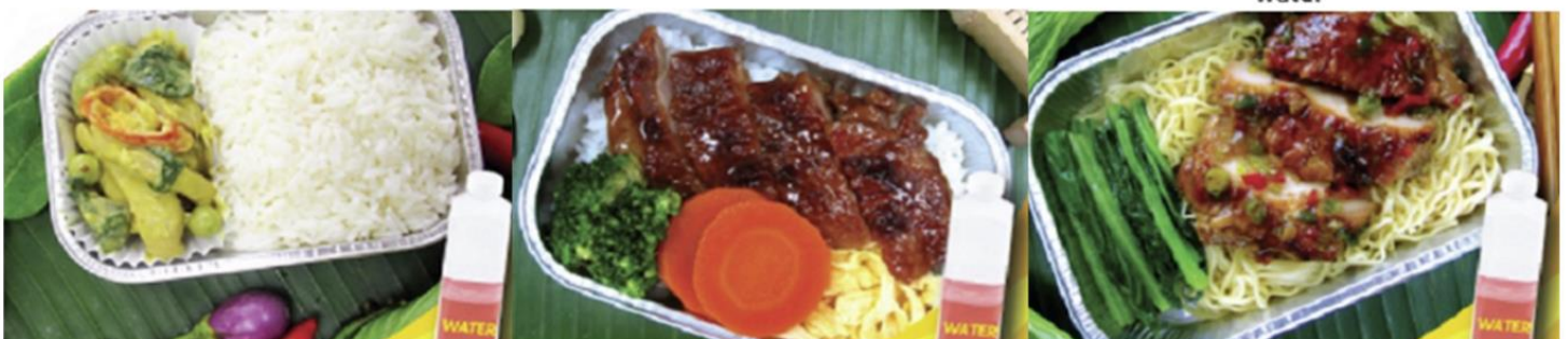
Chicken roasted with herb and noodle and water