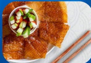
พิเศษ!! เมนูเปิดปักกิ่ง