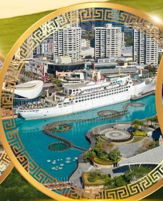
ท่าเรือ Sea World