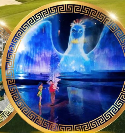
การแสดงม่านน้ำ