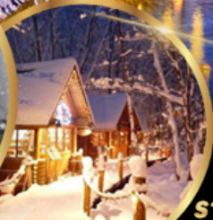
หมู่บ้านเทพนิยาย นิงเกิลเทอร์ส