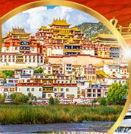
วัดชงจันหลิน