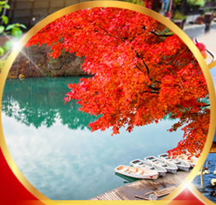
บึง 5 สี โทซึคิบุเมะ