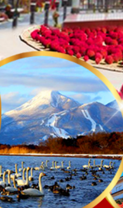
ทะเลสาบอินาวะชิโระ