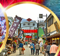
ย่านโบราณ ชิบูมาตะ