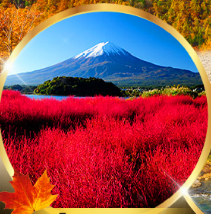
ไอชิ พาร์ค