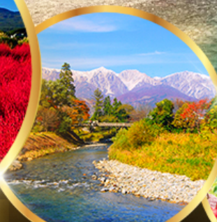
ไอจิ ทะ พาร์ค