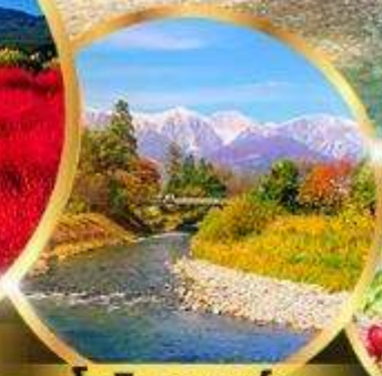
โออิตะ พาร์ค