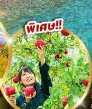
บฟเฟต์แอปเปิล