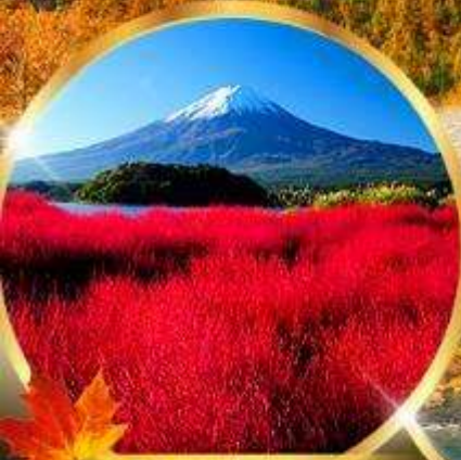
โออิชิ พาร์ค