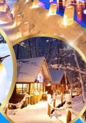
หมู่บ้านเทพนิยาย นิงเกิลทอเรส