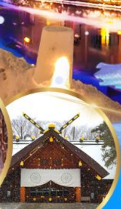
ศาลเจ้า ออกโทโต

เดินทาง 04 - 09 กุมภาพันธ์ 68 05 - 10 กุมภาพันธ์ 68