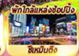
พักใกล้แหล่งช้อปปิ้ง ซิเหมินตง