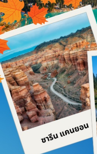
ชาริน แคนยอน